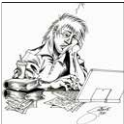
Schreibnacht © Furrer Samuel, 2015