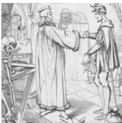
Teufelspakt Faust Mephisto

Dienstag 10. September, 19.30 - 20.30 Uhr