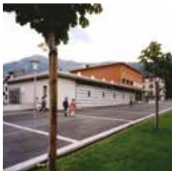
Mediathek Wallis - Brig