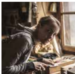
Et pourquoi pas?

Mardis 16 juillet et 20 août, 16h00 - 18h00