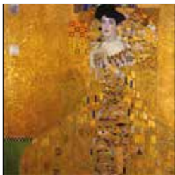
Gustav Klimt