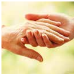
Alter © Africa Studio-Fotalia.com

Schlossstrasse 30 - 027 607 15 00 mw-brig-kulturvermittlung@admin.vs.ch www.mediathek.ch