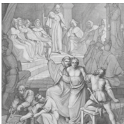
Das Ketzergericht. Die Entwicklung der Gottesidee. Düsseldorf, 1850