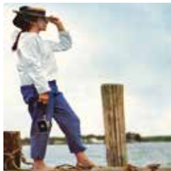
Exposition Bolex

Avenue de la Gare 15 - 027 607 15 40 mv-martigny-mediation@admin.vs.ch www.mediatheque.ch