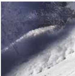
Expo «Neige: beauté fatale» jusqu'au 5 janvier 2019