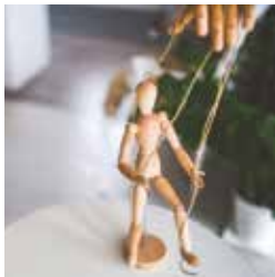
«Tous manipulés?» - Atelier dédié aux adolescents!

Rue de Lausanne 45 - 027 606 45 50 mv-sion-mediation@admin.vs.ch www.mediatheque.ch