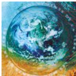
Les mouvements de la terre © Double hélice

Avenue du Simplon 6 - 027 607 15 80 mv-stmaurice-mediation@admin.vs.ch www.mediatheque.ch