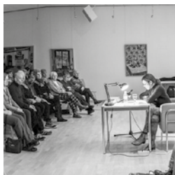
Literarischer Salon

Dienstag 13. November, 19.30 - 20.45 Uhr