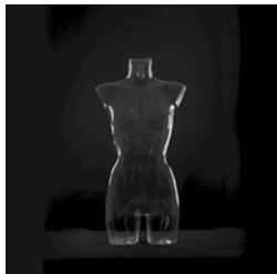
Constellation octodurienne © Aline Fournier

Avenue de la Gare 15 - 027 607 15 40 mv-martigny-mediation@admin.vs.ch www.mediatheque.ch