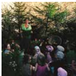
Märchen Wald