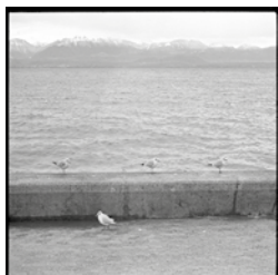
Détail photographie de l'exposition «Fonds ouvert»

Du 22 novembre au 9 mars 2019, L'Objectif, 7/7, 13h00 - 18h00