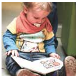
Les petits aiment les livres...

Avenue du Simplon 6 - 027 607 15 80 mv-stmaurice-mediation@admin.vs.ch www.mediatheque.ch