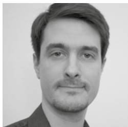
Yves Fournier © Droits réservés