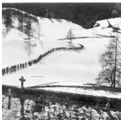
«Die letzte Chance» (1945) © Aline Fournier